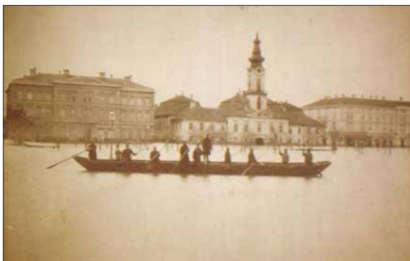
Obr. 6: Zatopená segedínská radnice a Széchenyiho náměstí v roce 1879

Na rozdíl od ostatních zkoumaných měst, jejichž prstencová struktura vznikla především transformací vojenského opevnění, je segedínský ring výsledkem jiné historické zkušenosti – katastrofální povodně (obr. 6). Roku 1879 byla většina města zničena rozvodněnou řekou Tisou; z téměř 6 000 budov zůstalo stát méně než 300 [Zombori, 2004, s. 19]. Katastrofa se stala impulzem pro kompletní přestavbu města podle regulačního plánu Lajose Lechnera, který navrhl novou uliční síť založenou na kombinaci radiálních tříd a okružních komunikací [Váraljai, 2024, s. 285]. Součástí tohoto systému byl i kruhový ochranný val (Szegedi Körtöltés), který tvořil základ systému protipovodňové ochrany a současně utvářel prostorovou strukturu města. Val, dlouhý přibližně 17 km, byl