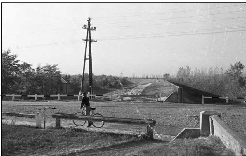
Obr. 7: Nová „městská hradba“, vnější protipovodňová hráz postavená po roce 1879 na konci bulváru Józsefa Attily

koncepován jako součást ochranné infrastruktury, přičemž jeho koruna sloužila jako komunikace a byla postupně integrována do systému městských tříd (obr. 7). V prvních desetiletích po svém vzniku plnil val především technickou funkci ochrany města, avšak jeho existence současně ovlivnila další urbanistický rozvoj Segedínu.