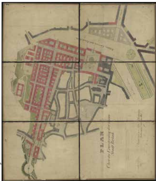
Obr. 1: Regulační plán Josefa Esche z roku 1845 se dvěma kompozičními osami – severojižní a východozápadní. Tyto bulváry byly zahrnuty i do následujících plánů a nakonec i realizovány