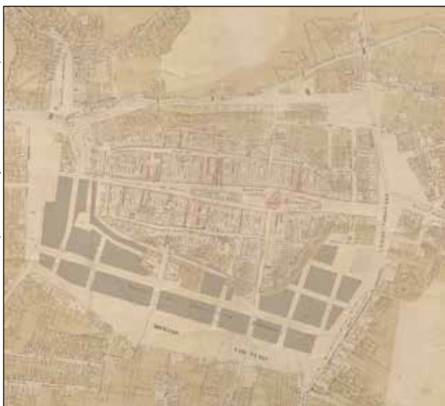
Obr. 5: V roce 1832 vyhotovil inženýr Joseph Ott mapu, do níž zakreslil plánované rozšíření města. Ott uvažoval o přibližně 1 km dlouhé přímé městské třídě a při návrhu uliční sítě vycházel z pravouhého rastru středověkých košických ulic. Vodní tok z příkopu chránícího pevnost svedl do přímého koryta, obdobně jako stromořadí promenády, které tuto logiku následovalo. Tato třída se později stala Rákócziho okružní třídou (dnes Moyzesova ulice)

a předměstími. Na Chunertově plánu [Bauer, 2016] z roku 1807 ještě vidíme pevnostní ovál téměř v plné síle. Klíčový je ovšem Ottův plán [Ott, 1832] z roku 1832, který zachycuje téměř úplné zničení zemních fortifikací a současně první návrh „narovnaní“ západní části budoucího okruhu – dnešní Moyzesovy ulice (obr. 5). Ottův návrh přináší do města výraznou ortogonální logiku: mezi historickým oválem a západními předměstími vkládá rovnou, více než kilometr dlouhou městskou třídu s pravouhlou sítí příčných ulic a plochami rezervovanými pro budoucí veřejné budovy [Sekan, 2024, s. 263–267]. Tím se zásadně liší od intuitivního očekávání, že Košice využijí oválný půdorys hradeb k vytvoření „dokonalého“ prstence. Místo toho vzniká okruh, který má v některých částech spíše polygonální charakter: navazující návrhy z druhé poloviny 19. století posilují pravouhlou strukturu parcel i uliční sítě, a to jak v západní části, tak v dalších segmentech kolem bývalého glacis.