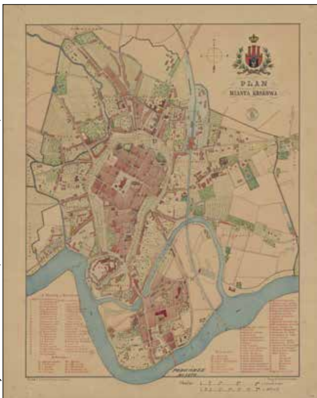
Obr. 3: Mapa Krakova z roku 1878, na které jsou již dobře patrné zelené okružní promenády, které zároveň vytyčují linii bývalého opevnění. Vytváření zeleného parkového okruhu bylo zahájeno již během ruské okupace v roce 1815 a navzdory politické nejistotě bylo v podstatě dokončeno do 30. let 19. století

ní Krakova do rakouské monarchie v roce 1846 získalo město opět zásadní vojenský význam. Rakouská armáda rozhodla o jeho přeměně na říšský pevnostní uzel schopný blokovat postup nepřátelských vojsk a zajistit mobilizaci císařské armády. V letech 1850–1856 byl královský hrad Wawel přeměněn na vojenskou pevnost a ve vzdálenosti několika kilometrů od centra vznikly nové pevnosti kontrolující hlavní přístupové komunikace. Současně byl vybudován souvislý obranný val eliptického tvaru doplněný bastiony a dalšími fortifikačními prvky, který vytvořil nový vojenský prstenec kolem města. Tento druhý obranný systém však rychle zastaral. Již po prusko-rakouské válce roku 1866 a zejména po zkušenostech z francouzsko-německé války 1870–1871 se ukázalo, že tradiční bastionové opevnění nedokáže odolat moderním zbraním. Od roku 1872 proto začala výstavba nového, vzdálenějšího systému samostatných fortů umístěných ve vzdálenosti 6–8 km od centra města. Tím se původní obranný val stal nadbytečným a postupně ztratil svůj význam. Přesto zůstával dlouho zachován, protože armáda neměla prostředky