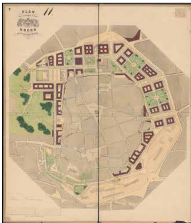
Obr. 2: Vítězný návrh z veřejné soutěže roku 1861. Z plánu je patrné rozdílné pojetí parkových ploch oproti předcházejícím regulačním plánům. V severojižní ose však stále chybí dominanta – dnešní kostel

o urbanistické uchopení pevnostního úpatí Špilberku – jediného místa, kde vojenské úřady povolily rozšíření města. Esch navrhoval soustavu dvou kolmých kompozičních os: jedna směřovala od průčelí kostela sv. Tomáše, druhá od obelisku míru na Franzenbergu [Kuča, 2000, s. 97]. I když nebyl v plném rozsahu realizován, přinesl do Brna princip monumentální městské kompozice, která využívá bývalé vojenské plochy pro civilní funkce – úřady, školství a nové obytné bloky. Na Eschovy úvahy navázal v 50. letech 19. století městský inženýr Josef Seifert, který již pracoval s představou souvislého okružního systému. Jeho regulační návrhy počítaly s postupným zastavováním glacis a vytvořením širokých tříd, které by obklopovaly historické jádro a současně umožnily jeho další rozvoj. Seifert tak poprvé formuloval představu souvislé okružní třídy vznikající na místě bývalého glacis, která měla umožnit regulované rozšíření města a propojit nové stavební plochy kolem historického jádra. V 60. letech 19. století na tyto koncepční úvahy navázaly soutěžní návrhy regulace celého prostoru bývalého opevnění, které již pracovaly s jasně definovanou představou souvislého